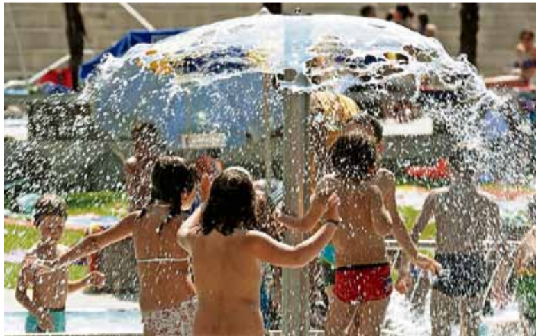
La prima settimana del 2014 faceva registrare solo 5.184 entrate.